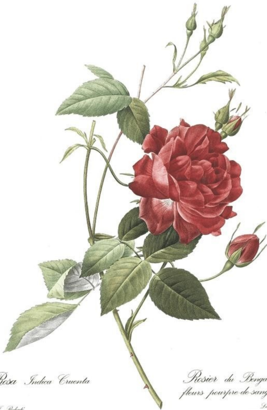
Rosa Indica Cruenta