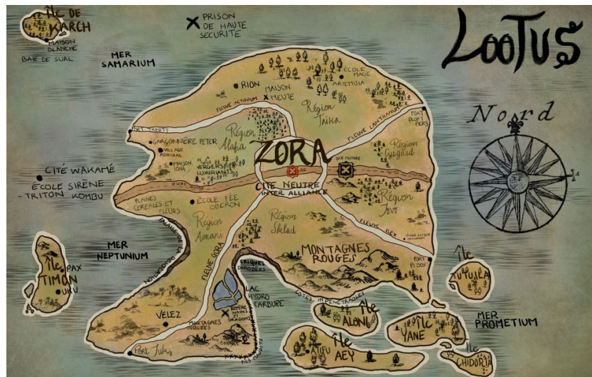
Carte de Lootus